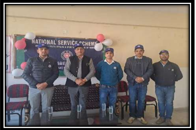
छायाचित्र: शिविर के चतुर्थ दिवस की विभिन्न गतिविधियों में भाग लेते हुए NSS के स्वयंसेवक।