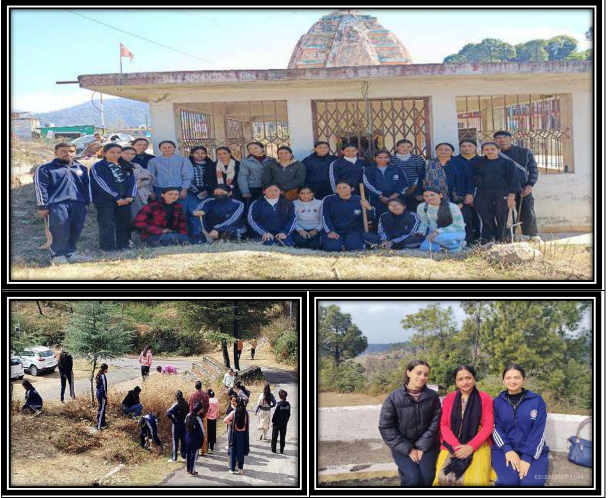
छायाचित्र: शिविर के छठे दिवस की विभिन्न गतिविधियों में भाग लेते हुए NSS के स्वयंसेवक।

और सभी स्वयंसेवियों की हाजिरी ली गई। अन्त में “राष्ट्रीय गान” के साथ सात दिवसीय NSS शिविर के छठे दिवस का समापन हुआ।