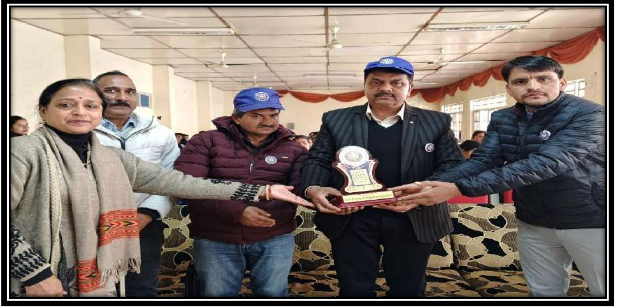
छायाचित्र: NSS कार्यक्रम अधिकारी मुख्यातिथि महोदय का स्वागत करते हुए तथा शिविर के प्रथम दिन की कार्यवाही में भाग लेते हुए स्वयंसेवक।

सभी स्वयंसेवियों को अगले दिन की दिनचर्या के बारे में बताया और सभी स्वयंसेवियों की हाजिरी ली गई। अन्त में "राष्ट्रीय गान" के साथ सात दिवसीय NSS शिविर के प्रथम दिवस का समापन हुआ।