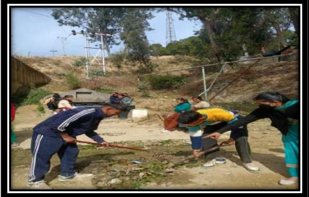
छायाचित्र: शिविर के तृतीया दिवस की विभिन्न गतिविधियों में भाग लेते हुए NSS के स्वयंसेवक।