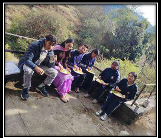
छायाचित्र: शिविर के समापन दिवस की विभिन्न गतिविधियों में भाग लेते हुए NSS के स्वयंसेवक।