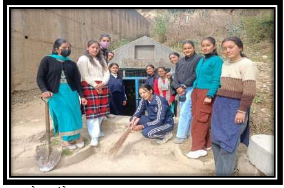
छायाचित्र: शिविर के द्वितीय दिवस की विभिन्न गतिविधियों में भाग लेते हुए NSS के स्वयंसेवक।