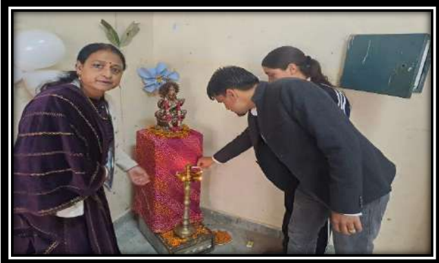
छायाचित्र: शिविर के पंचम दिवस की विभिन्न गतिविधियों में भाग लेते हुए NSS के स्वयंसेवक।