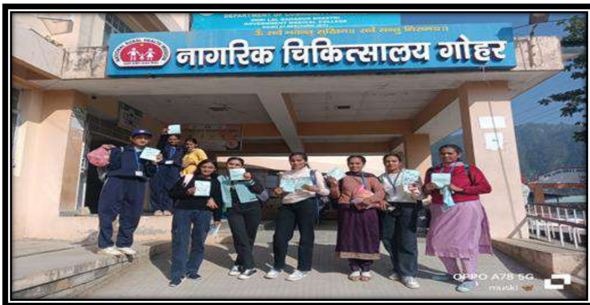
Photographs of Hospital Visit under the Theme ‘Ye Diwali MY BHARAT Wali’.